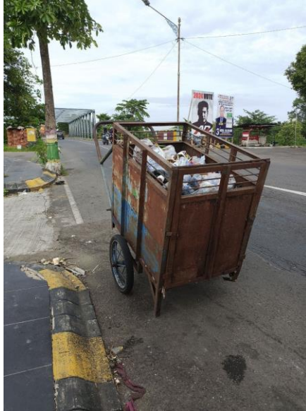
Gambar 1 Gerobak Sampah untuk Alat Angkut Sampah ke TPS3R