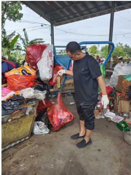
Gambar 2. Menimbang Berat Sampah 50 Kg