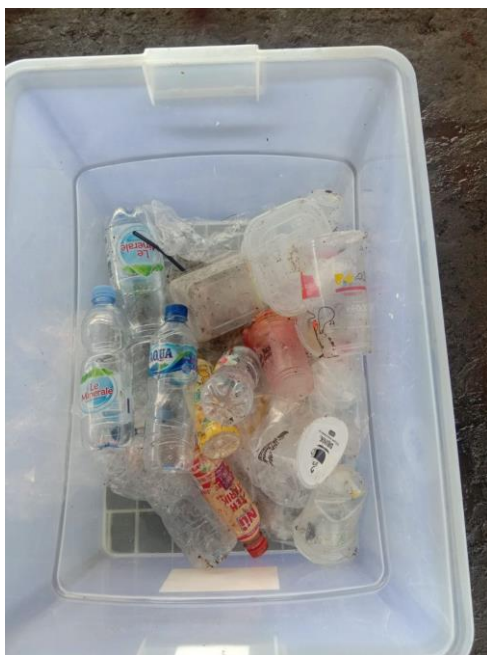
Gambar 4 Pengukuran Volume Setiap Komposisi Sampah