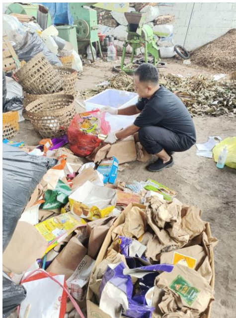
Gambar 3. Pemilahan Sampah setiap Komposisi sampah