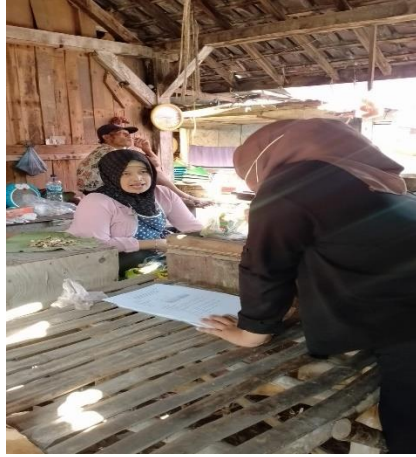
Gambar 1 Wawancara dengan pedagang