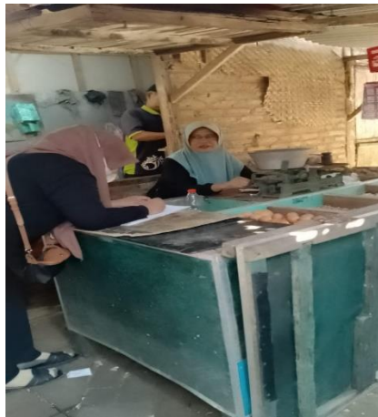
Gambar 3 Wawancara dengan pedagang