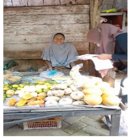
Gambar 2 Wawancara dengan pedagang