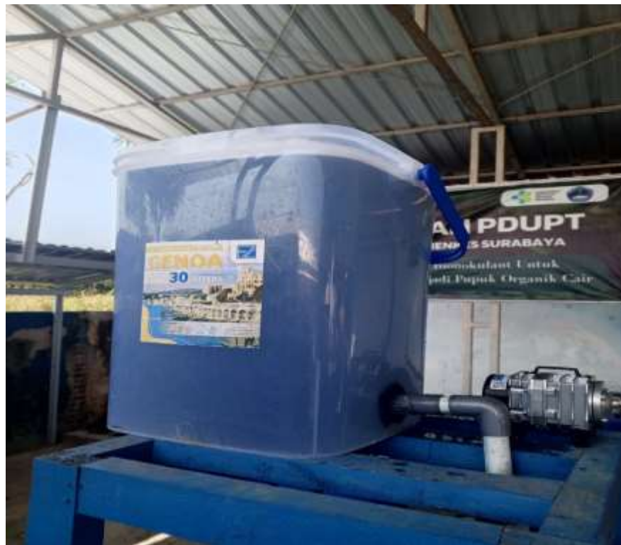
Bak Inlet (Bak Penampungan Limbah Laundry)