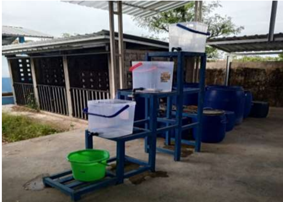
Gambar Alat Penelitian