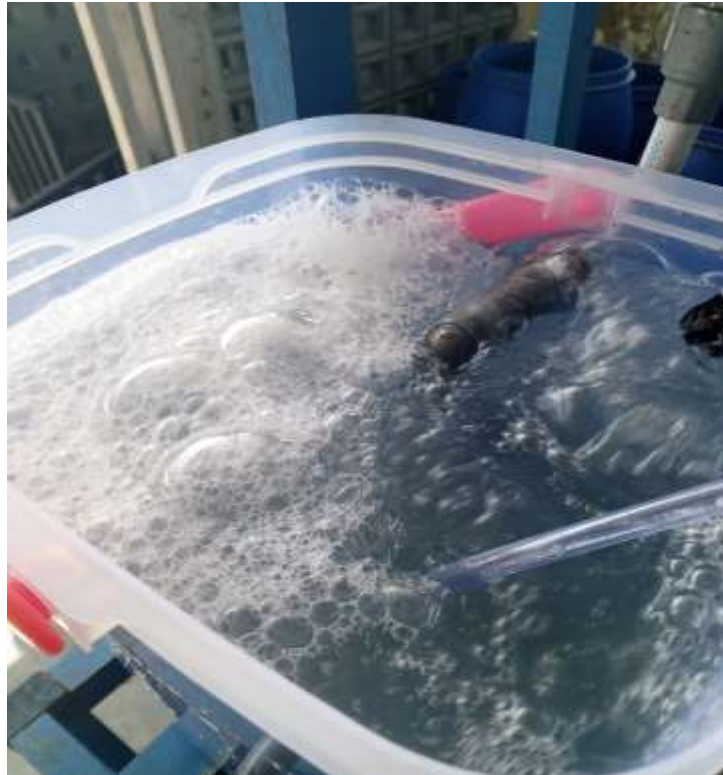
Proses Aerasi menggunakan bubble aerator dan bioball