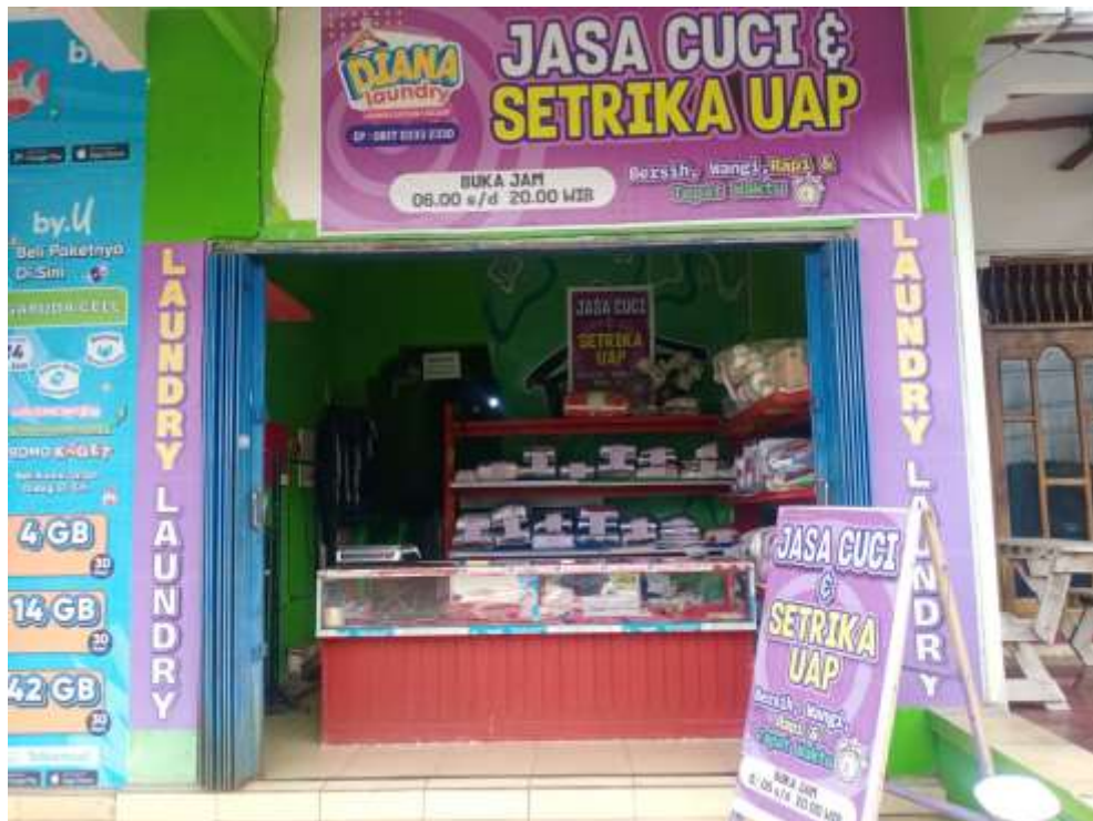
Keterangan : Lokasi penelitian