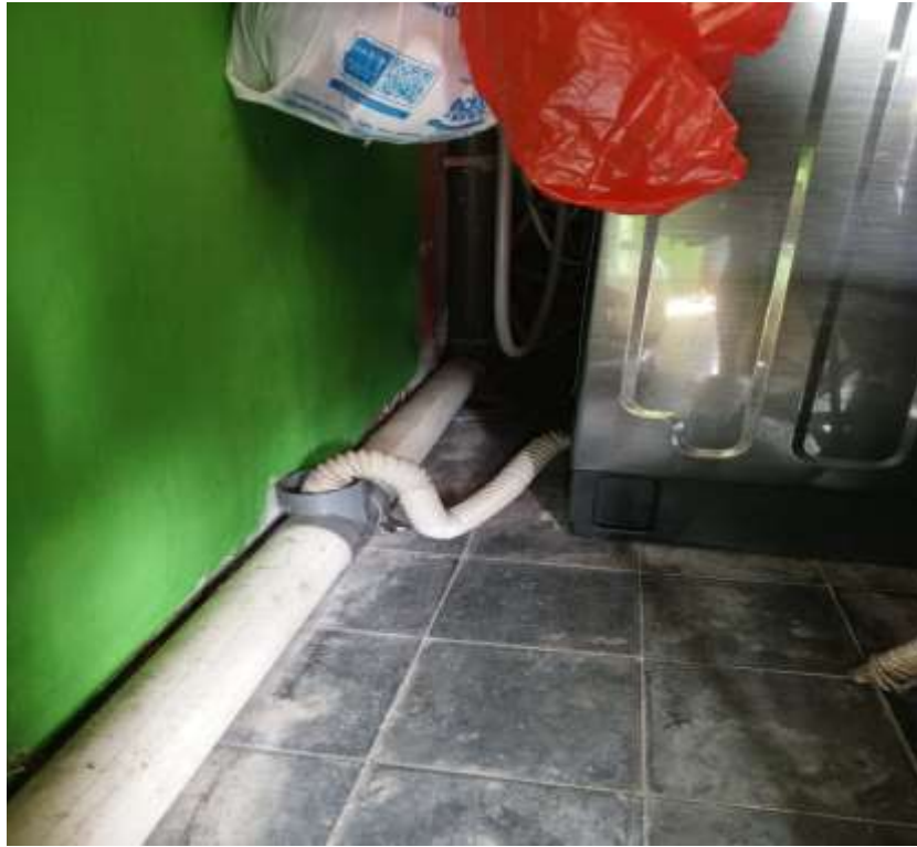
Keterangan : Saluran pembuangan yang menuju ke selokan