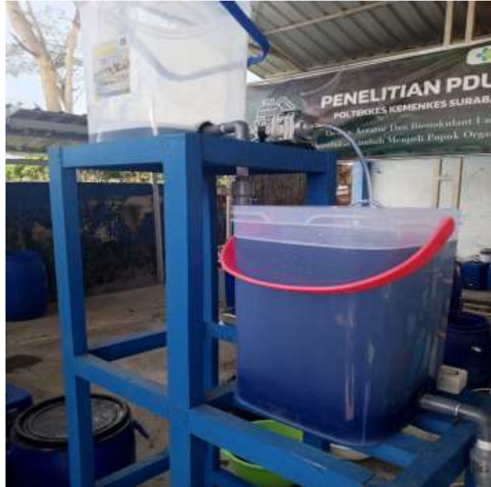
Bak Pemrosesan Limbah