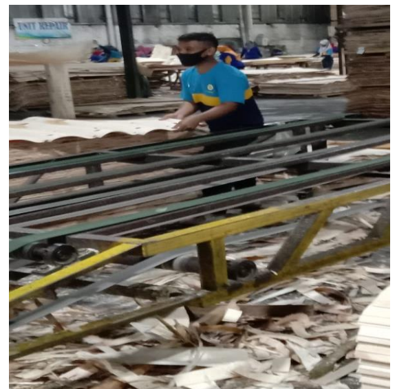
Setelah proses pemotongan