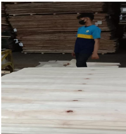
Lembaran kayu untuk triplek