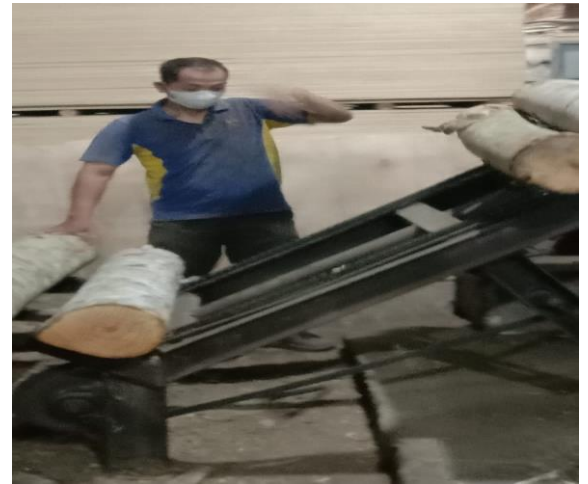
Proses pemotongan kayu