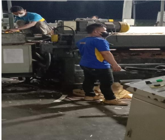
Penyiapan alas kayu