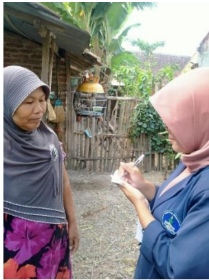
Gambar 8. Wawancara Reponden