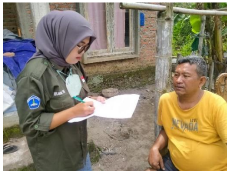
Gambar 3. Wawancara Responden