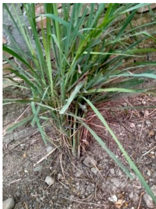
Gambar 10. Tanaman Pengusir Nymuk