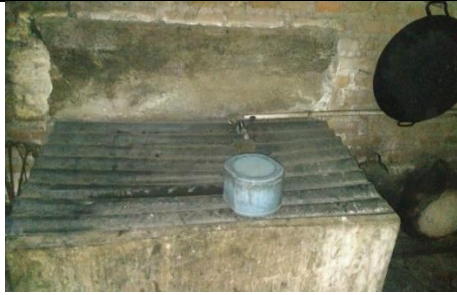
Gambar 7. Kebiasaan Menutup Penampungan Air