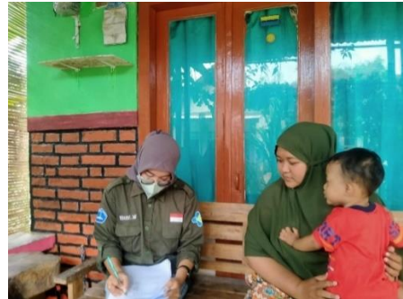
Gambar 2. Wawancara Responden