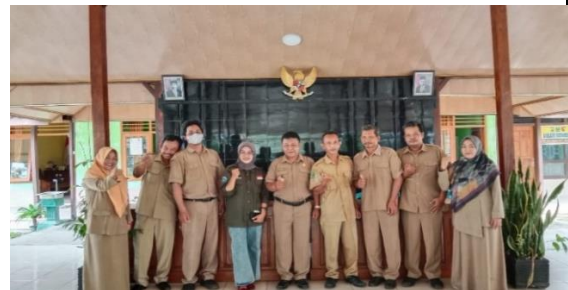
Gambar 11. Foto Bersama dan Izin Penelitian kepada Kepala Desa Dan Lurah Desa Balegondo Kec. Ngariboyo Kab. Magetan Tahun 2023