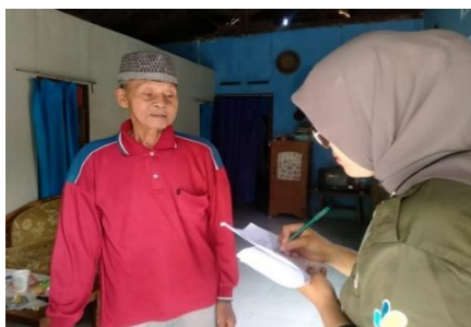
Gambar 5. Wawancara Responden