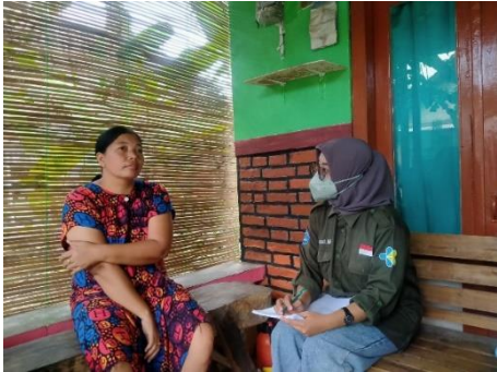
Gambar 1. Wawancara Responden