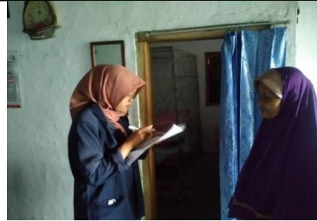
Gambar 8. Wawancara Responden Yang Masih memakai Kelambu Tidur