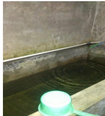
Gambar 9. Kebiasaan Tidak meguuras Bak mandi