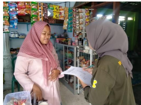
Gambar 4. Wawancara Responden Rt 3