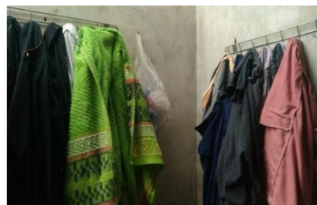
Gambar 6. Kebiasaan Menggantung Pakaian