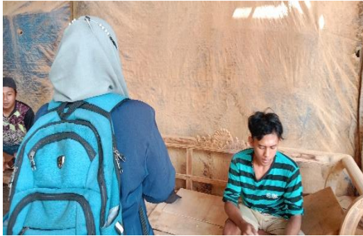
Gambar 1 Wawancara dengan responden