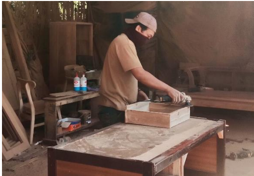
Gambar 7 Proses penghalusan furniture yang sudah dirakit