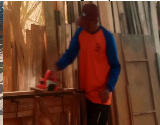
Gambar 4 Proses penghalusan kayu