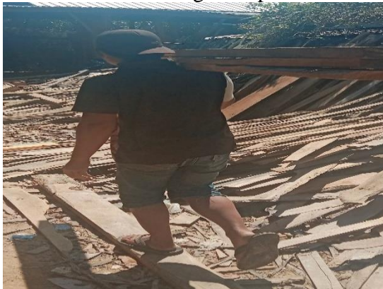
Gambar 3 Proses pengangkutan kayu