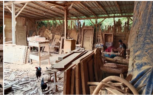
Gambar 10 Furniture yang siap dihaluskan kembali