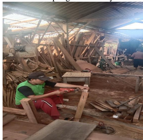
Gambar 6 Proses propil