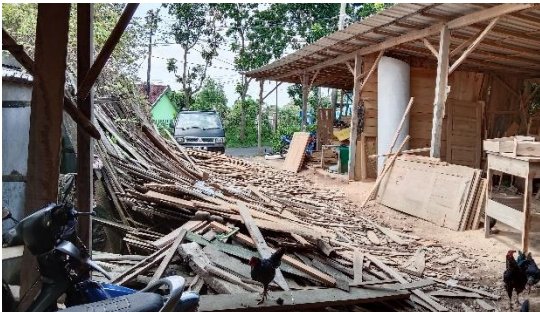
Gambar 9 Tumpukan kayu setelah dipotong