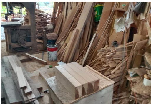
Gambar 11 Kayu yang siap dirakit