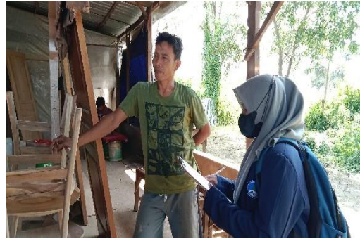
Gambar 2 Wawancara dengan responden