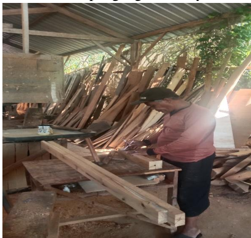
Gambar 5 Proses perakitan