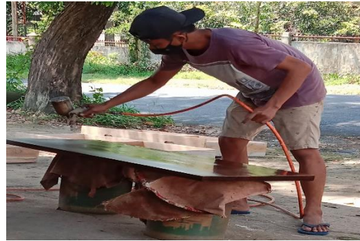
Gambar 8 Proses finishing