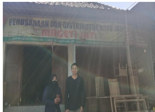
Gambar 12 Dokumentasi dengan pemilik industri