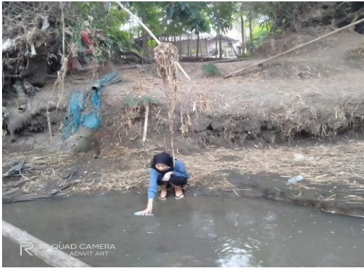
15. Pengambilan Sampel