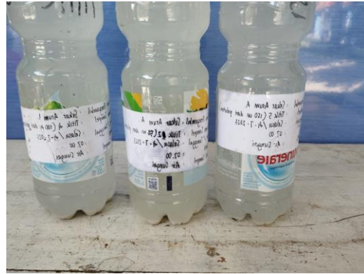
16. Pengiriman Sampel di Laboratorium