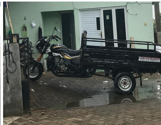
Gambar 6 Kendaraan pengangkut sampah