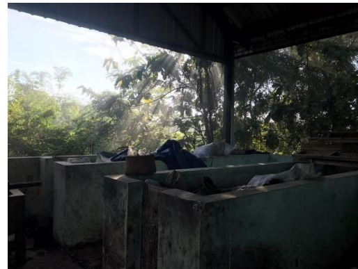
Gambar 4 Area reduce, reuse dan recycle