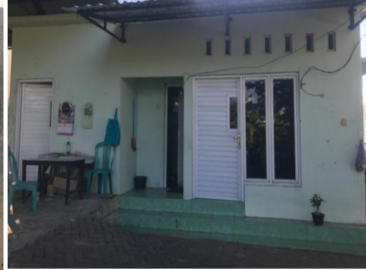
Gambar 2 Bangunan kantor, toilet dan gudang