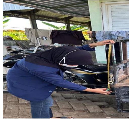
Gambar 8 Pengukuran kendaraan pengumpul