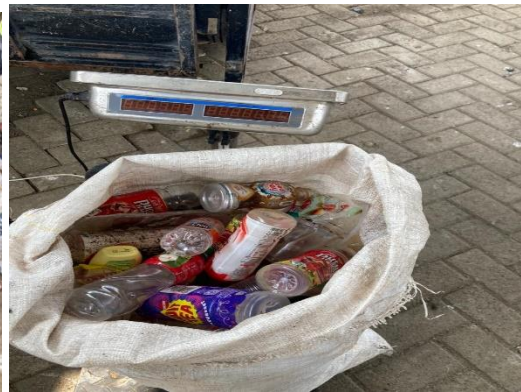
Gambar 10 Hasil pemilahan botol