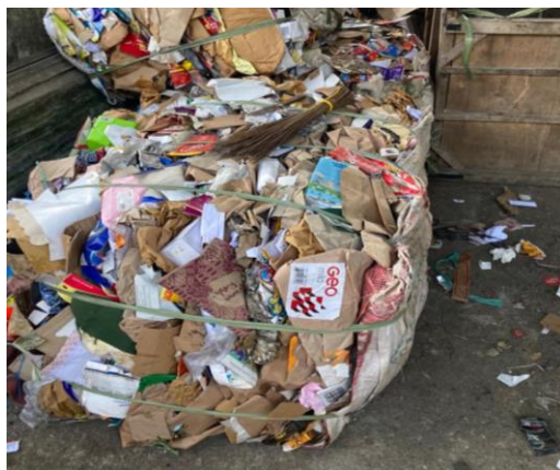
Gambar 11 Hasil komposisi sampah berupa sampah kertas