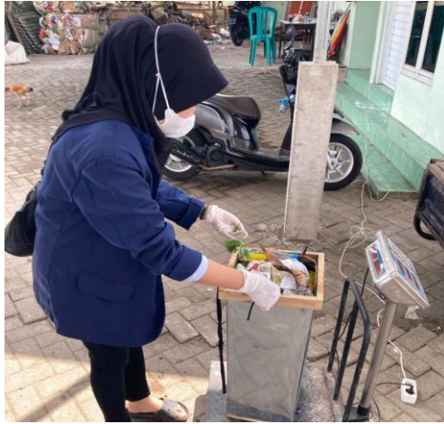
Gambar 7 Pengukuran densitas