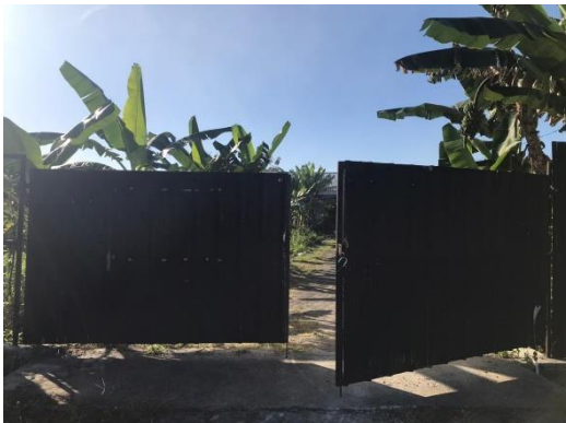
Gambar 3 Pintu masuk TPS 3R