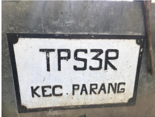
Gambar 1 Profil TPS 3R Parang Indah