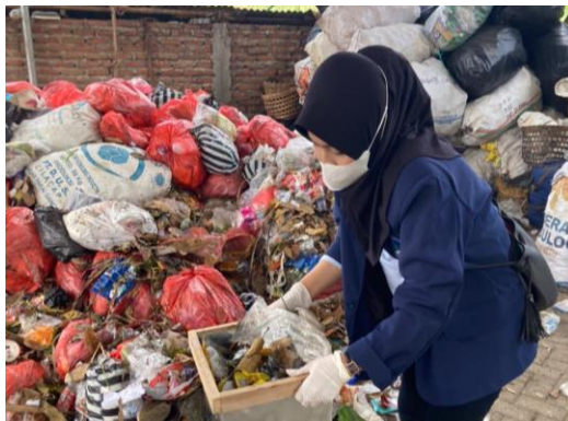
Gambar 9 Penimbangan komposisi sampah