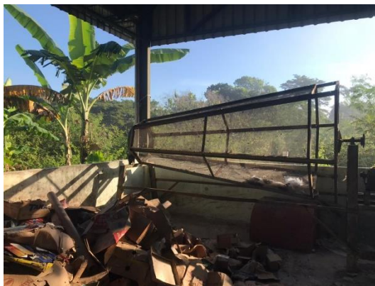
Gambar 5 Area Pengomposan