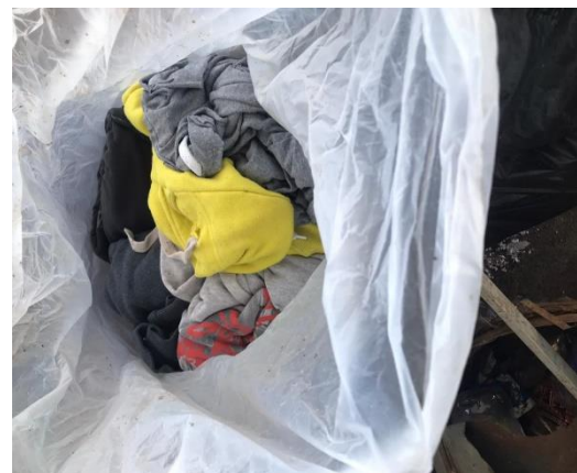
Gambar 12 Hasil komposisi sampah berupa sampah kain