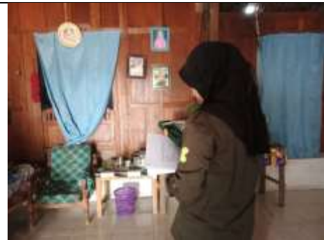
Gambar 10. Kondisi Dinding responden