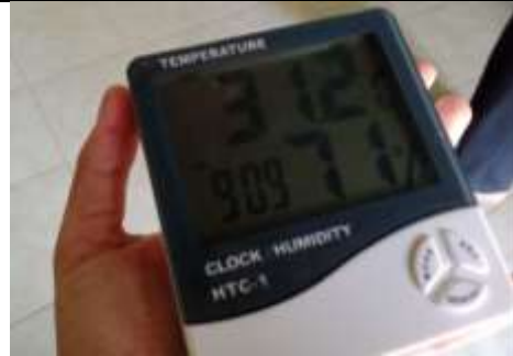
Gambar 8. Hasil pengukuran suhu dan kelembaban yang melebihi baku mutu