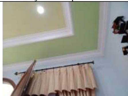
Gambar 6. Kondisi Atap responden