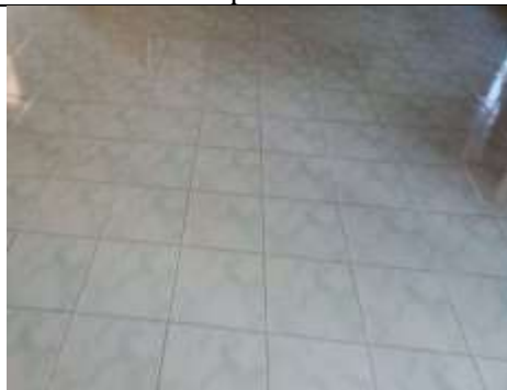
Gambar 11. Kondisi lantai responden