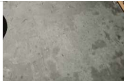
Gambar 12. Kondisi lantai responden