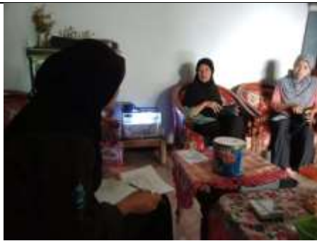
Gambar 1. Wawancara dengan responden