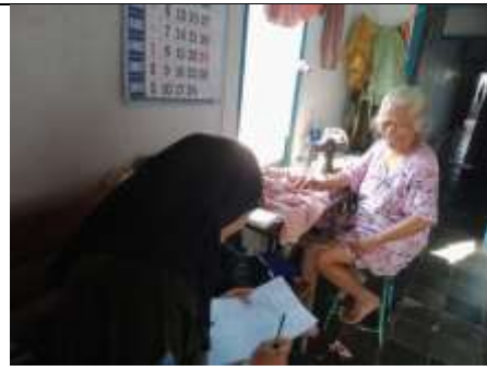
Gambar 2. Wawancara dengan responden