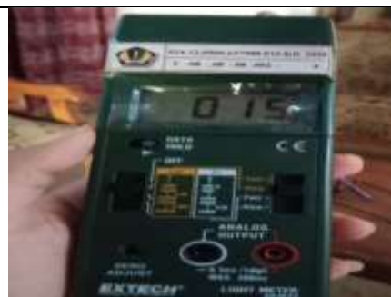
Gambar 14. Kondisi ventilasi responden