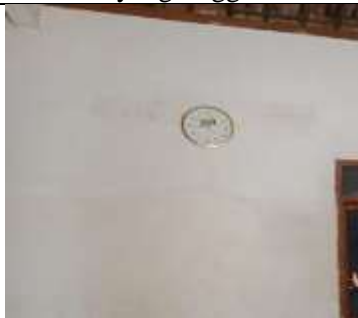
Gambar 9. Kondisi dinding rumah responden