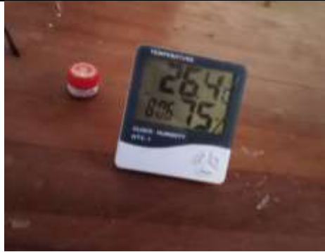
Gambar 7. Hasil pengukuran kelembaban yang tinggi