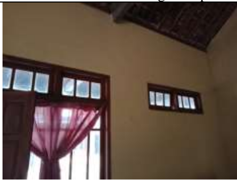
Gambar 3. Kondisi ventilasi responden