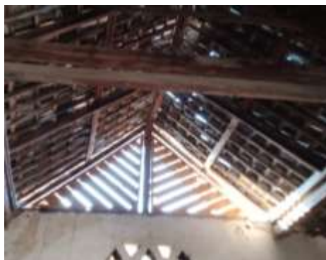
Gambar 5. Atap responden