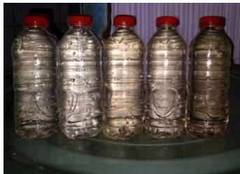
Sampel air sebelum perlakuan