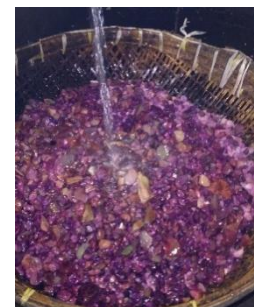
Pencucian zeolit setelah perendaman