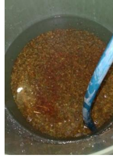
Pengaliran Air ke dalam bak oksidasi