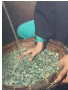
Pencucian zeolit sebelum perendaman