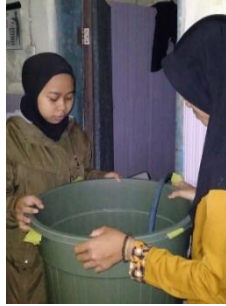
Pengaliran Air ke dalam bak oksidasi