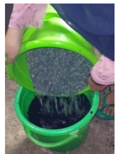
Perendaman Zeolit pada \text{KMnO}_4