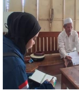
Permintaan izin kepada pengasuh pondok