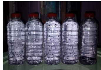
Sampel air sesudah perlakuan