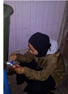
Pengambilan sampel setelah perlakuan