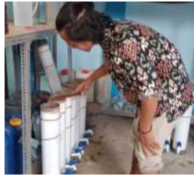
Proses Pencampuran Bahan