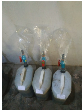
Digester dengan gas