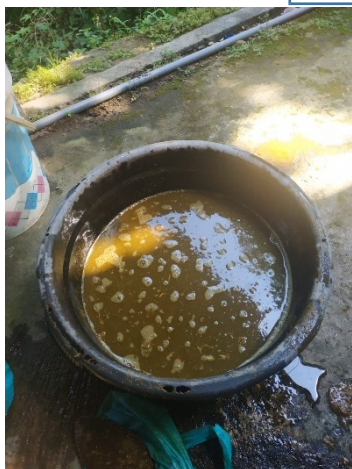
Kotoran Sapi 1kg dengan air 2 L