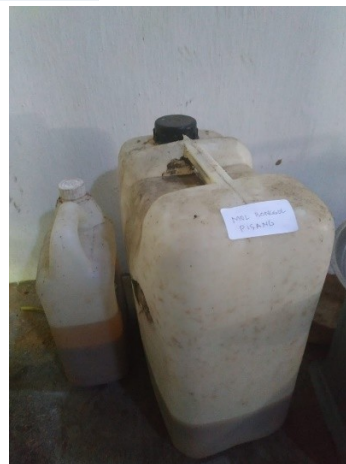
Mol Bonggol Pisag