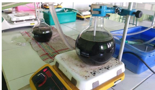
Gambar 3. Proses Destilasi