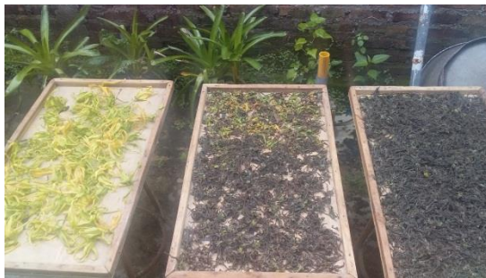
Gambar 1. Pengeringan Bunga Kenanga