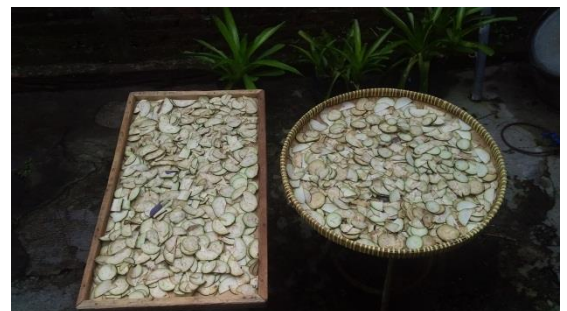
Gambar 2. Pengeringan Buah Terung Ungu Panjang