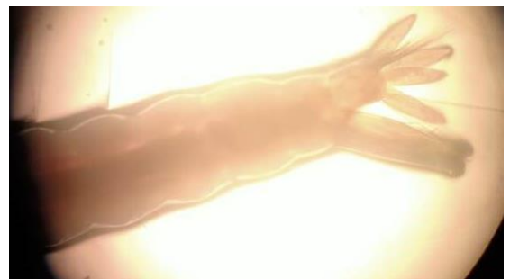
Gambar 10. Siphon Larva Culex sp