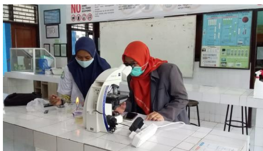
Gambar 5. Pengecekan Larva Culex sp Oleh Pembimbing