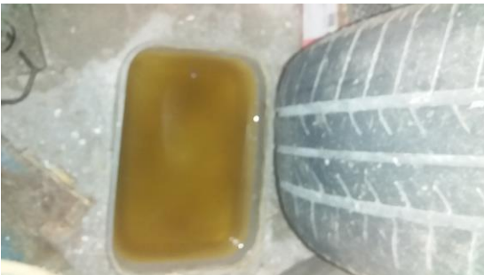
Gambar 11. Tempat Pencarian Larva Culex sp