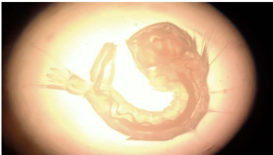
Gambar 9. Larva Culex sp