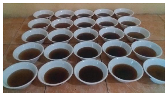
Gambar 12. Proses Pengamatan Kematian Larva