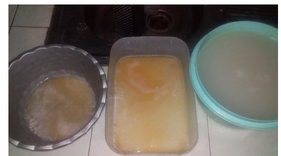
Gambar 4. Media Perkembangbiakan Larva Nyamuk Culex sp