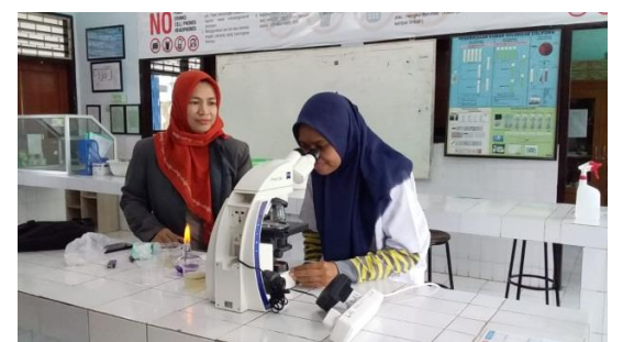
Gambar 6. Pengecekan Larva Oleh Peneliti