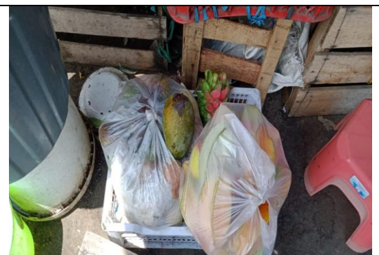
Limbah Buah di Pasar Sayur Magetan