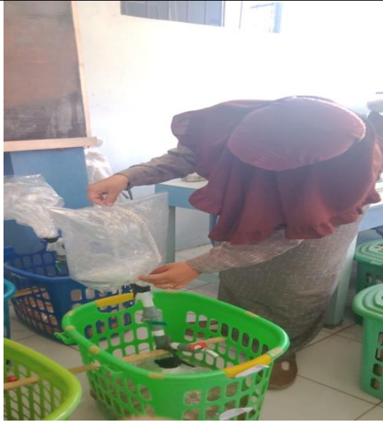
Mengukur Volume Biogas