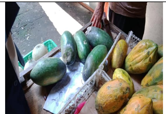
Limbah Buah di Pasar Sayur Magetan