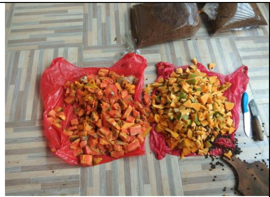
Pencacahan Limbah Buah