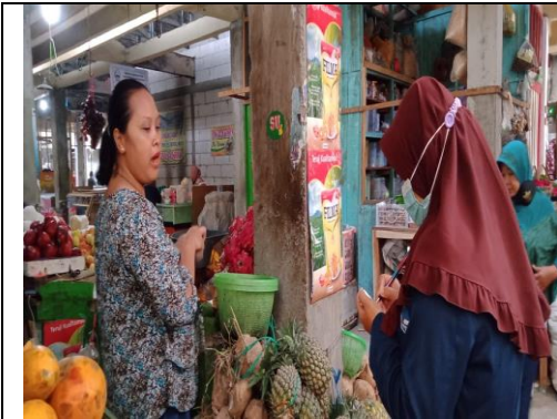
Wawancara pedagang pasar