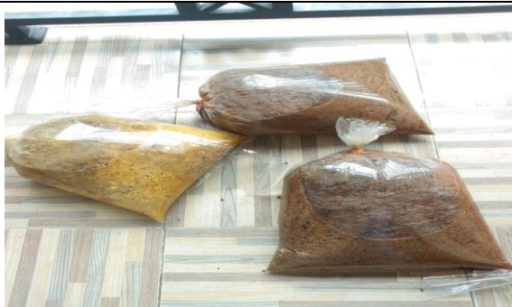
Limbah Buah Setelah di Blender