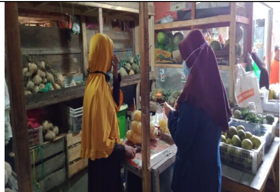
Wawancara pedagang pasar