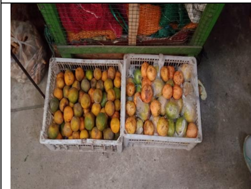
Limbah Buah di Pasar Sayur Magetan