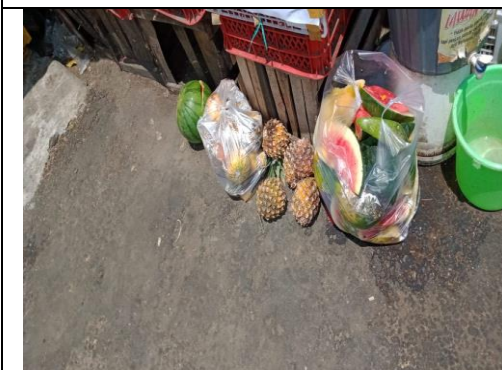
Limbah Buah di Pasar Sayur Magetan