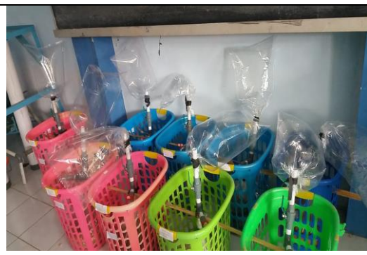
Muncul Gas yang akan diamati