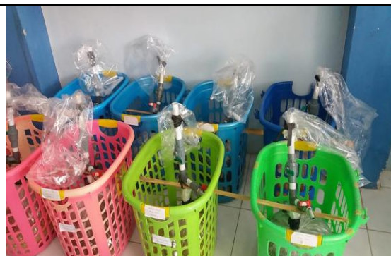
Biogas Siap Diamati