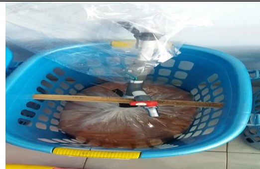
Rancangan biogas tampak atas