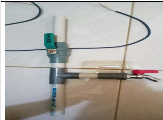
Rancangan Alat Biogas