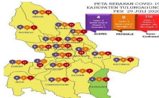
Gambar 1.1 Peta Sebaran Covid -19 di Kabupaten Tulungagung https://faktualnews.co/images/2020/07/covid-19-tla-531x640.jpg

dari pengabdian tersebut agar masyarakat dapat terhindar dari virus yang ada dilingkungan sekitar kita, dengan harapan jumlah penderita semakin kecil.