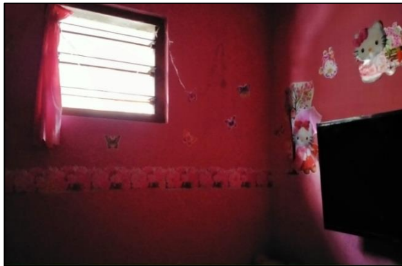
Gambar 1. Kamar Suspek Penderita Difteri dengan Nilai Kondisi Lingkungan Fisik Hunian Cukup