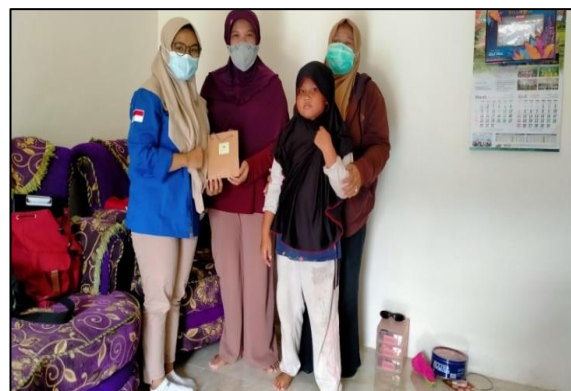
Gambar 6. Pemberian Tali Asih