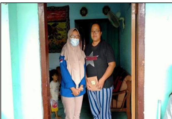
Gambar 5. Pemberian Tali Asih