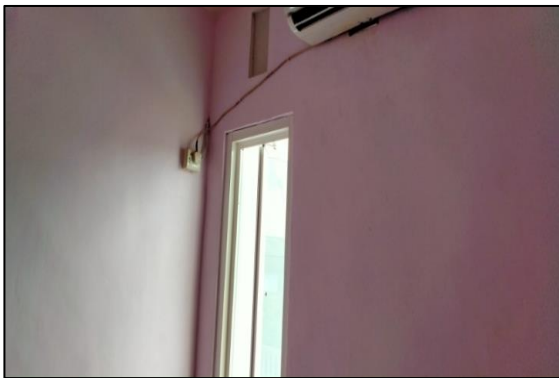
Gambar 3. Kamar Suspek Penderita Difteri dengan Nilai Kondisi Lingkungan Fisik Hunian Baik