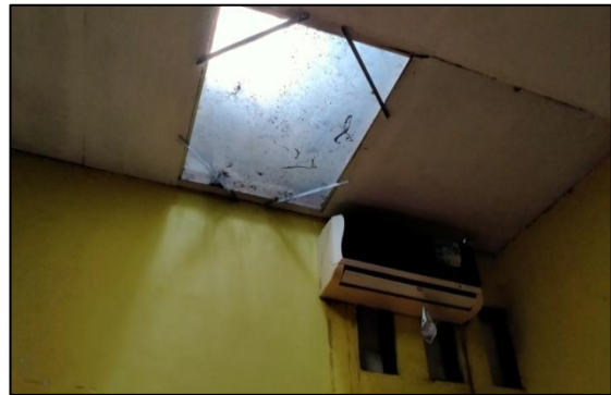
Gambar 2. Kamar Suspek Penderita Difteri dengan Nilai Kondisi Lingkungan Fisik Hunian Cukup