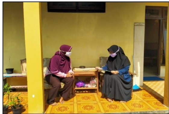
Gambar 4. Memberikan Penjelasan Mengenai Penelitian