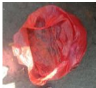
Sampah sayur yang sudah dicacah