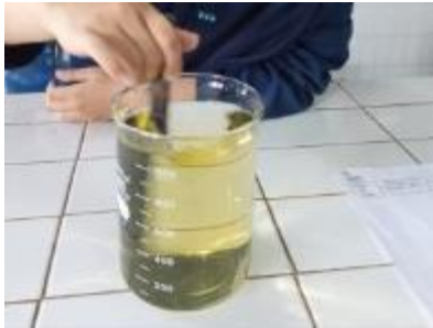
Pengadukan bahan media untuk isolat