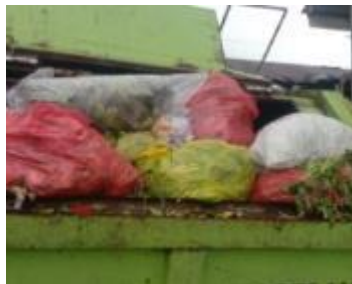
Pengambilan sampel sampah sayur