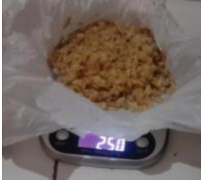
Menimbang bahan media untuk isolat