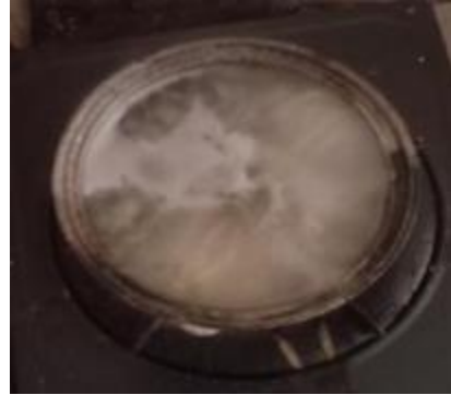
Merebus bahan media untuk isolat