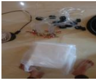
Penyiapan alat bahan