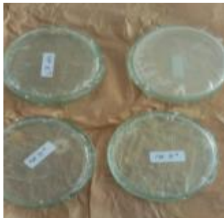
Hasil dari bakteri dan jamur