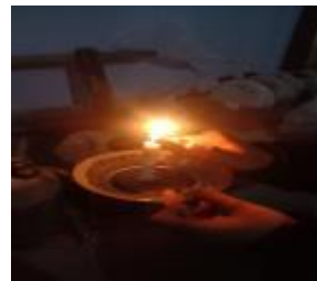
Uji nyala api