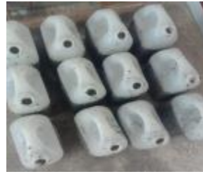
Pemasukkan ke digester