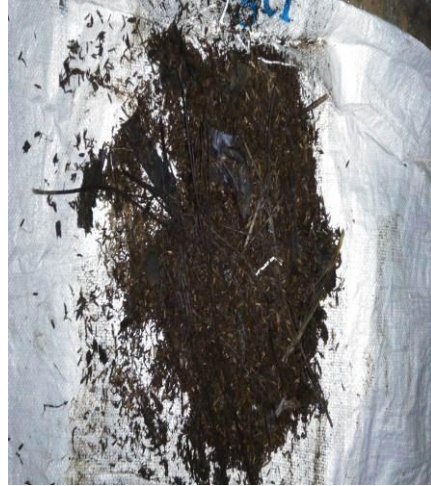
Hasil Pengamatan Pembuatan Kompos TR1 Minggu ke 4