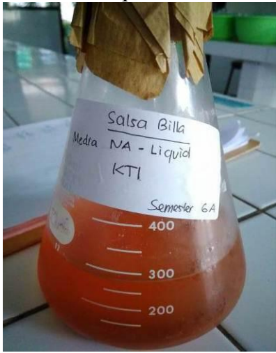
Media Na Liquid