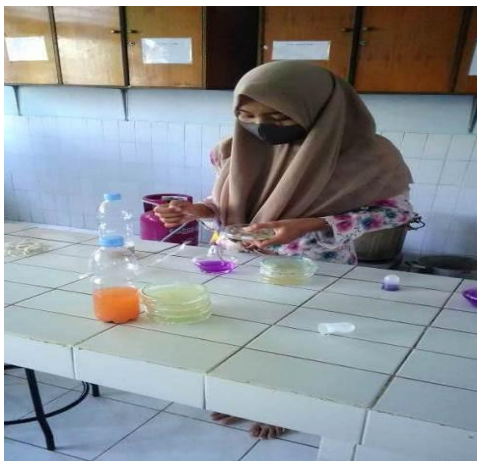
Pemindahan Isolat Bakteri dan Jamur ke Larutan NA dan Larutan PDA