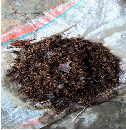
Hasil Pengamatan Pembuatan Kompos MR1 Minggu ke 3 atau Hari 21