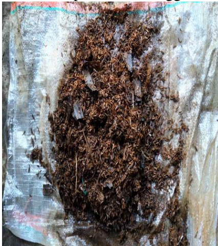
Hasil Pengamatan Pembuatan Kompos MR3 Minggu ke 3