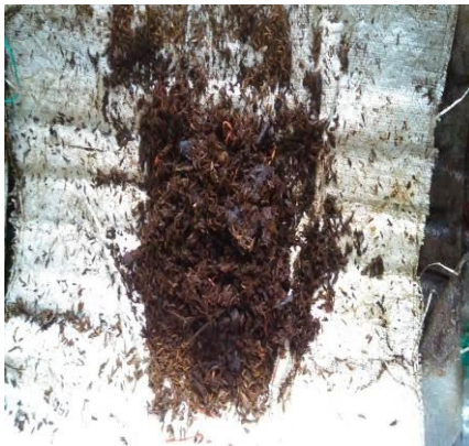
Hasil Pengamatan Pembuatan Kompos MR2 Minggu ke 3 atau Hari 21