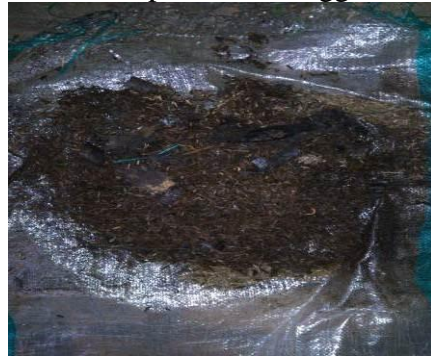
Hasil Pengamatan Pembuatan Kompos TR2 Minggu ke 4