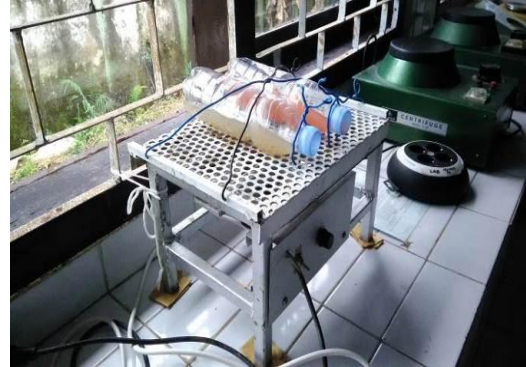
Kegiatan Shaker larutan NA dan Larutan PDA