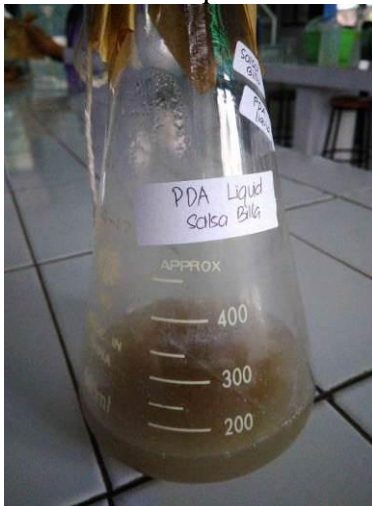
Media PDA Liquid