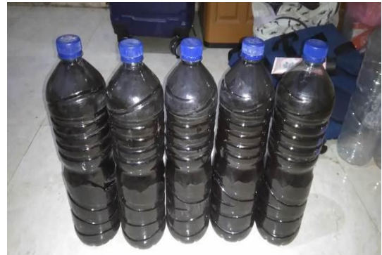
Fermentasi Produk MOL