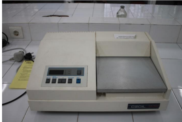
Gambar 2.2. Spektrofotometer Uv-Vis

dilihat oleh manusia, namun beberapa hewan, termasuk burung, reptil dan serangga seperti lebah dapat melihat sinar pada panjang gelombang UV (Suhartati, 2017).