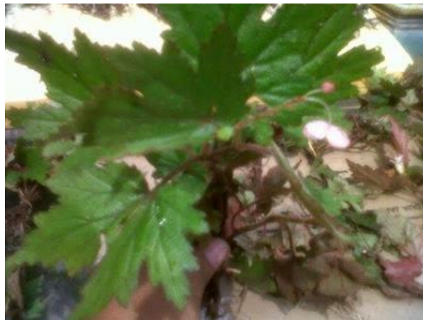
Gambar 2.1 Benalu Batu ( Begonia sp. )

Tumbuhan Benalu Batu ( Begonia sp. ) merupakan salah satu tumbuhan yang digunakan secara empiris oleh masyarakat untuk mengobati berbagai penyakit seperti yang ditunjukkan pada gambar 2.1. Tanaman ini digunakan untuk pengobatan tumor dan kanker (Novriawan, 2009 dalam Ritna, dkk., 2016).