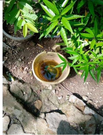
Kontainer Penuh Jentik pada Pot Bunga