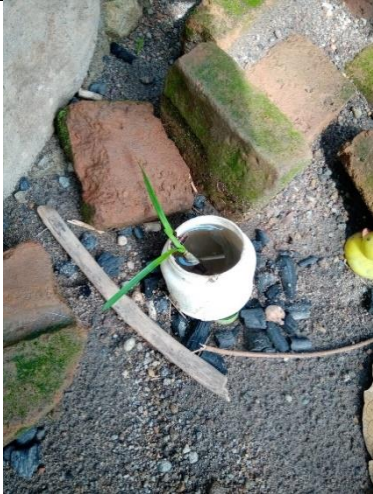
Kontainer yang Tidak Dibersihkan