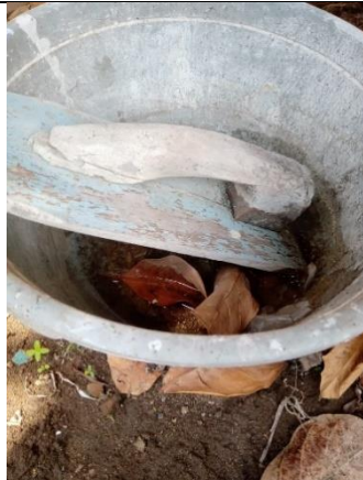
Pot Tanaman yang Tidak Dibersihkan Sebagai Kontainer Berjentik