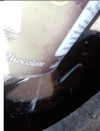
Kontainer di Luar Rumah yang Berisi Jentik