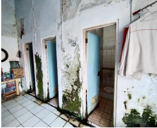
Dinding toilet berlumut dan terdapat barang pribadi milik pengelola di sekitar kamar mandi