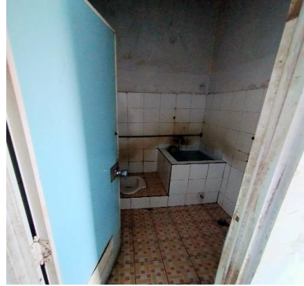
Tidak terdapat ventilasi atau lubang penghawaan yang sesuai