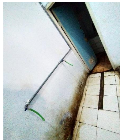
Air buangan wudhu dialirkan melalui bilik kamar mandi