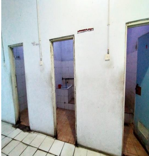
Dinding berwarna teran, terdapat pencahayaan buatan dari lampu, dan lantai mudah dibersihkan