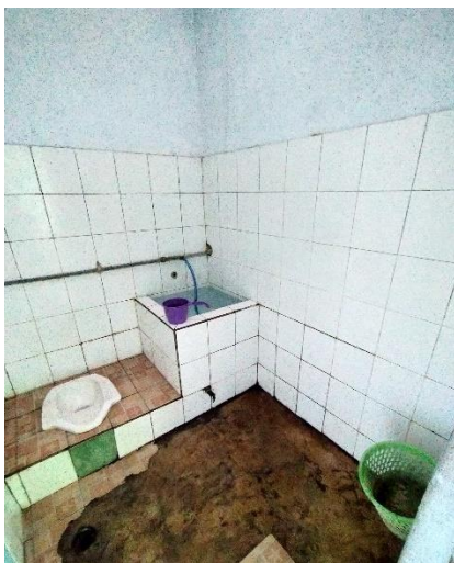
Keramik pada lantai rusak, menggunakan pencahayaan alami di siang hari