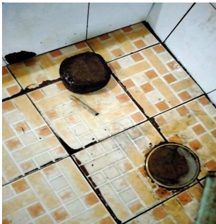
Ditemukan putung rokok di lantai toilet