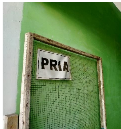
Terdapat pemisah antara Pria dan Wanita