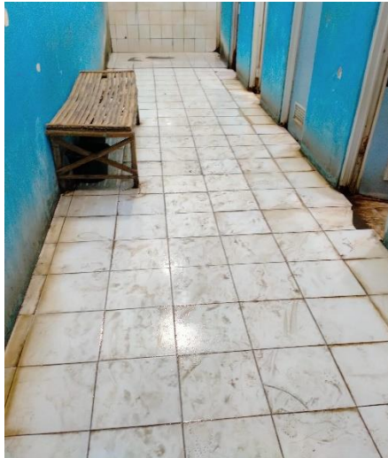
Lantai lincin dan kotor