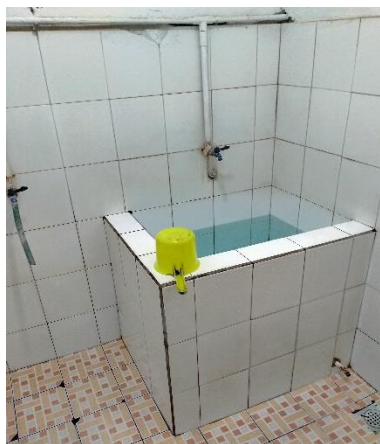
Tersedia air bersih dalam jumlah yang cukup dan dilengkapi gayung dengan kondisi baik dan layak pakai