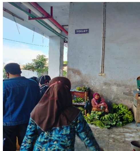
Terdapat penjual makanan yang berbatasan langsung dengan dinding toilet