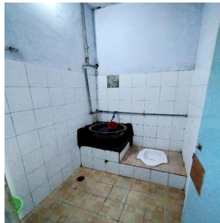
Bak penampung air rusak dan diganti dengan bak plastik