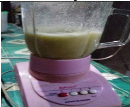
Buah Belimbing Wuluh dibleder atau dihaluskan