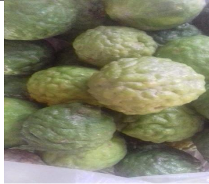
Buah Jeruk Purut Yang berwarna Kuning