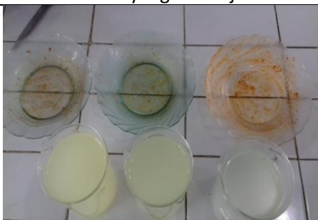
Piring sebelum perlakuan