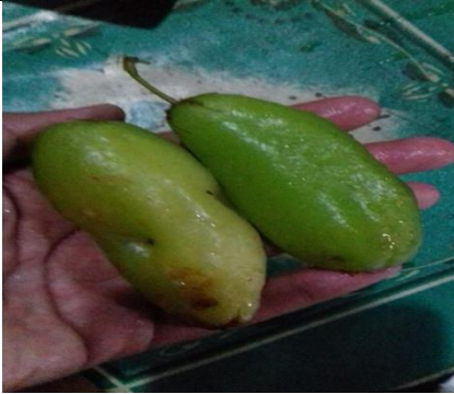
Buah belimbing wuluh yang sudah berwarna kuning