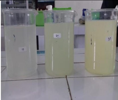
Larutan yang sudah jadi