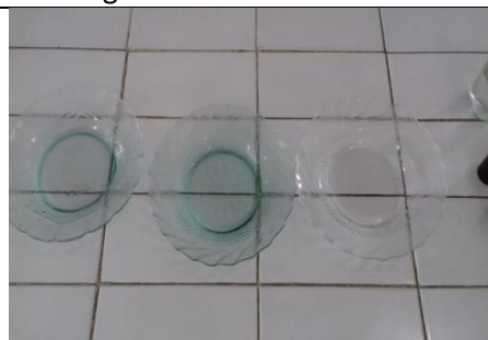
Piring sesudah perlakuan