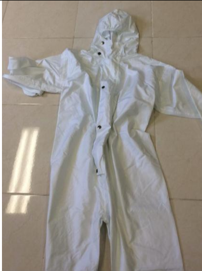
Gambar 5. Gaun Pelindung