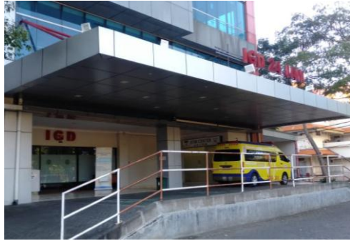
Gambar 7. IGD RS Universitas Airlangga