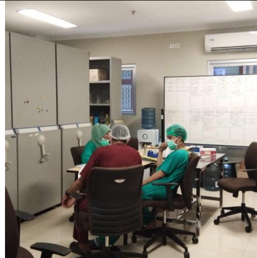
Gambar 6. Ruang Istirahat dalam IGD