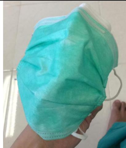
Gambar 4. Masker