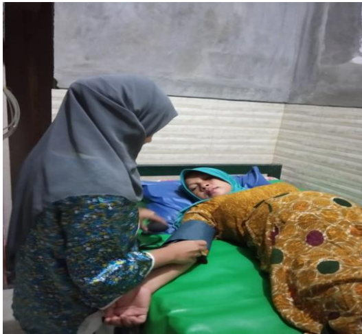
Foto Kunjungan ANC