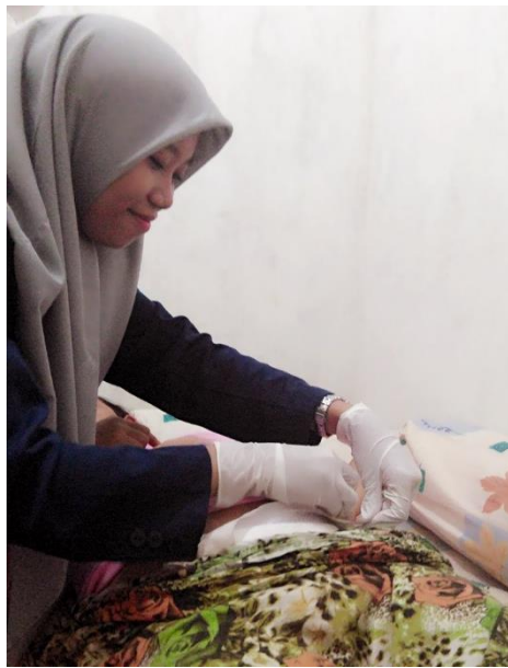
FOTO KUNJUNGAN NIFAS