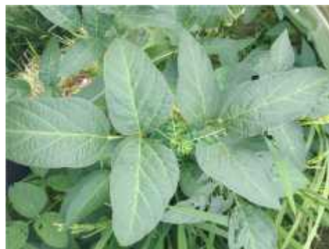
Gambar 2.6. Daun Tanaman Kacang Kedelai

Daun tanaman kedelai memiliki bentuk bulat oval dan lancip, kedua bentuk daun ini dapat dipengaruhi faktor genetik. Secara umumnya bentuk daun kedelai ini mempunyai bentuk daun lebar, memiliki stomata dan berjumlah 190 – 320 buah/m 2 (Adisarwanto, 2008). Daun memiliki bulu dengan warna cerah dan jumlahnya bervariasi. Panjang bulu ini mencapai 1 mm bahkan lebih dan memiliki lebar 0,0025 mm tergantung dengan varietas yang di gunakan.