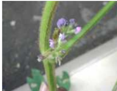
Gambar 2.7. Bunga Tanaman Kacang Kedelai

Bunga tanaman kedelai adalah bunga sempurna, bunga tanaman kedelai memiliki 5 helai daun mahkota, 1 helai bendera, 2 helai sayap dan 2 helai tunas. Benang sari pada tanaman kedelai berjumlah 10 buah, 9 buah diantaranya bersatu yang terdapat dibagian pangkal yang membentuk seludang yang mengelilingi putik (Hidayat, 2000). Bunga kedelai ini tumbuh diketiak daun yang membentuk rangkaian bunga yang terdiri 3 – 15 buah bunga di setiap tangkainya. Bunga kedelai ini memiliki warna kemerahan dan keunguan.