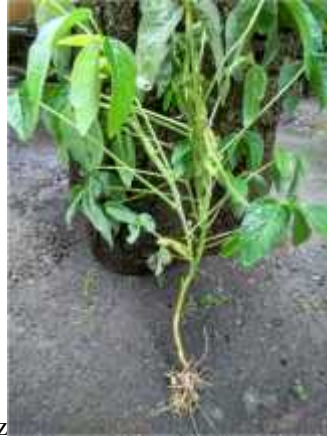
Gambar 2.3. Tanaman Kedelai

Komponen utama yang mendukung morfologi pertumbuhan yang optimal pada tanaman kedelai adalah : akar, daun, batang, bunga dan biji. Biji kedelai terbagi menjadi dua bagian utama yaitu : kulit biji dan janin/embrio (Suprpto, 2002). Menurut Inawati (2000) biji kedelai mampu menyerap air cukup banyak sehingga menyebabkan beratnya menjadi dua kali lipat. keebalan biji kedelai berpengaruh pada sifat yang keras dan daya serap air. Sehingga biji kedelai yang kering akan berkecambah apabila memperoleh air yang cukup.