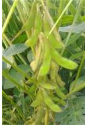
Gambar 2.8. Buah Tanaman Kedelai