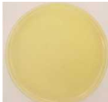
Gambar 2.2. Media Nutrient Agar

Agar adalah agen pematangan yang paling umum digunakan di media mikrobiologis. Agar adalah polisakarida ekstrak dari ganggang laut. Mencair pada suhu 84 ° C dan membeku pada 38 ° C. Konsentrasi agar 15,0 g / L biasanya digunakan untuk membentuk media padat. Konsentrasi lebih rendah 7,5 hingga 10,0 g / L digunakan untuk menghasilkan lunak agars atau media semi-padat (Ronald , M., 2006).