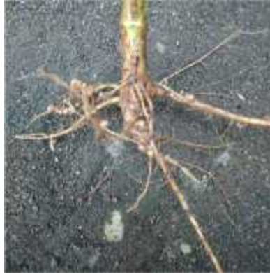
Gambar 2.4. Akar Tanaman Kacang Kedelai

sekunder (serabut). Pertumbuhan akar tunggang ini mencapai 2 m bahkan lebih sesuai dengan pertumbuhan kedelai dan menembus bagian tanah dengan kedalaman 30 – 50 cm. Sedangkan akar serabut mencapai kedalaman 20 – 30 cm, perkecambahan akar kedelai ini tumbuh dengan baik sekitar 3 – 4 hari (Adisarwanto, 2008).