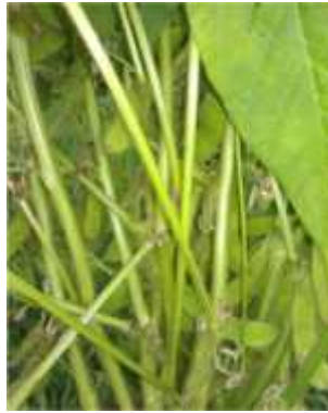
Gambar 2.5. Cabang dan Batang Tanaman Kacang Kedelai