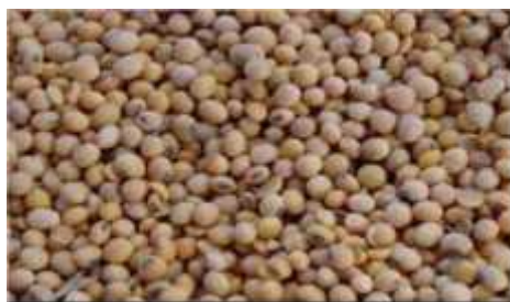
Gambar 2.9. Biji Kedelai

Biji tanaman kedelai memiliki bentuk, ukuran dan warna yang sangat bervariasi tergantung dengan varietasnya. Bentuk biji bulat lonjong, bulat dan bulat agak pipih. Warna biji berwarna putih, kuning, hijau, coklat hingga berwarna kehitaman. Ukuran biji kedelai memiliki ukuran kecil, sedang dan besar. Namun, di beberapa negara memiliki ukuran sekitar 25 gram / 100 biji, sehingga dikatakan biji dengan kategori berukuran besar (Hidayat, 2000).