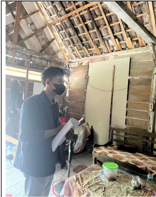
Pengukuran Parameter Pencahayaan di Rumah Penderita