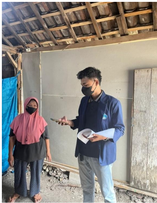
Penilaian Parameter Fisik Lanantai di Rumah Penderita