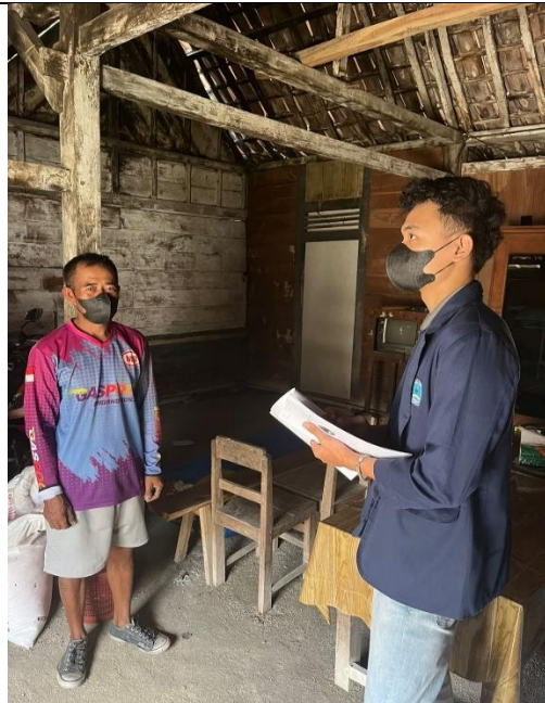
pengukuran Suhu dan Kelembaban di rumah Penderita