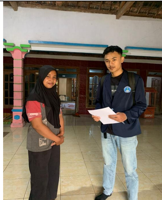
penilaian Parameter Fisik Lantai di rumah non Penderita