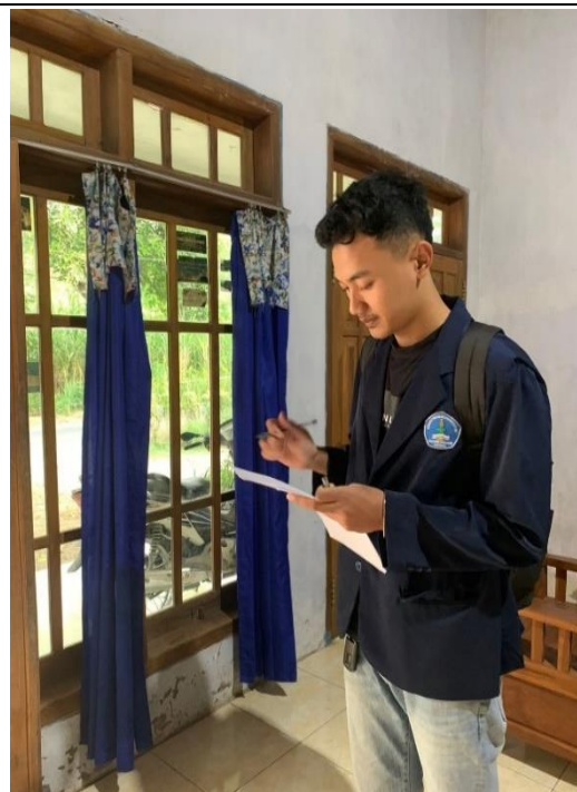
Luas Ventilasi Rumah non Penderita