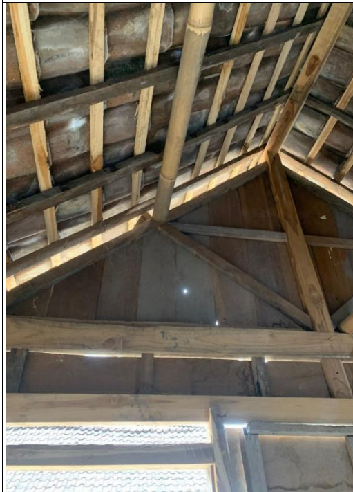
Luas Ventilasi Rumah penderita