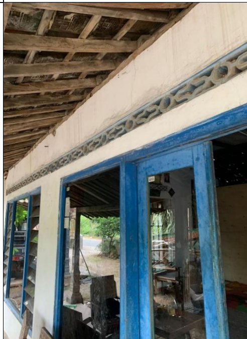
penilaian Parameter Fisik Dinding di Rumah non Penderita