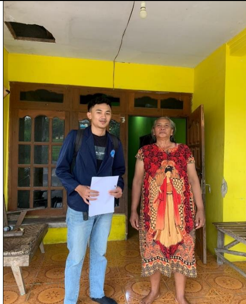
penilaian Parameter Fisik Dinding di Rumah Penderita