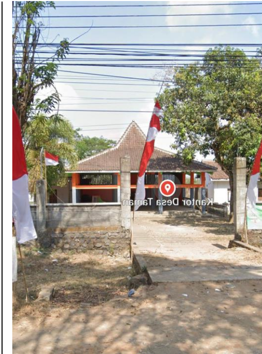
Kantor Desa Taman