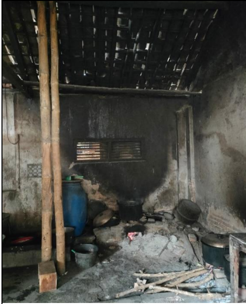
penilaian Parameter Fisik Dinding di Rumah Penderita