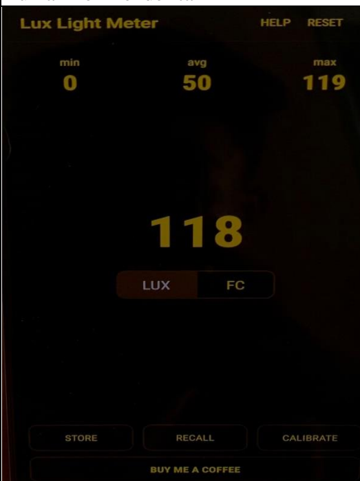
Pengukuran Parameter Pencahayaan di Rumah non Penderita