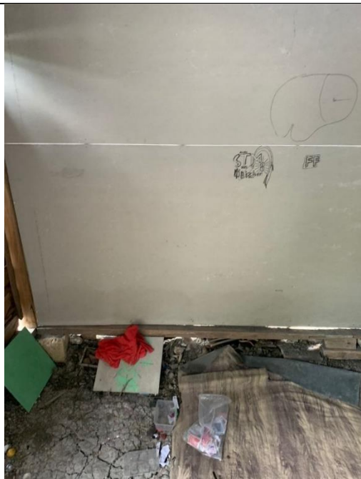
penilaian Parameter Fisik Dinding di Rumah Penderita