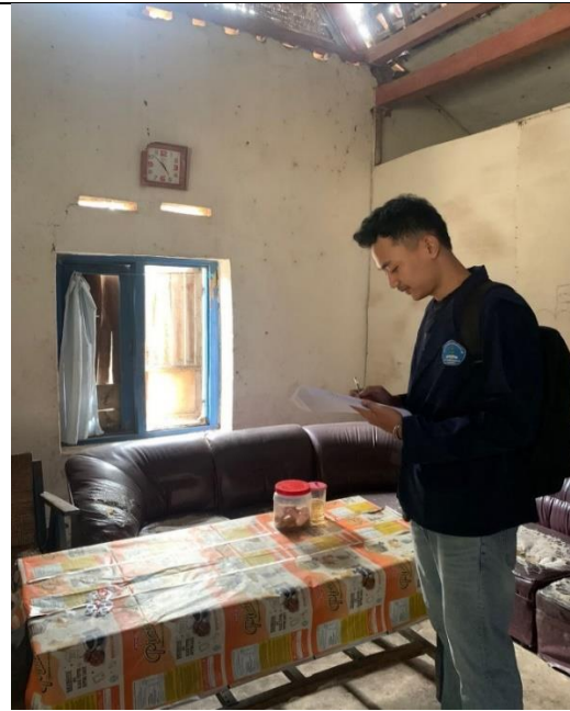
pengukuran suhu dan kelembaban di Rumah non Penderita