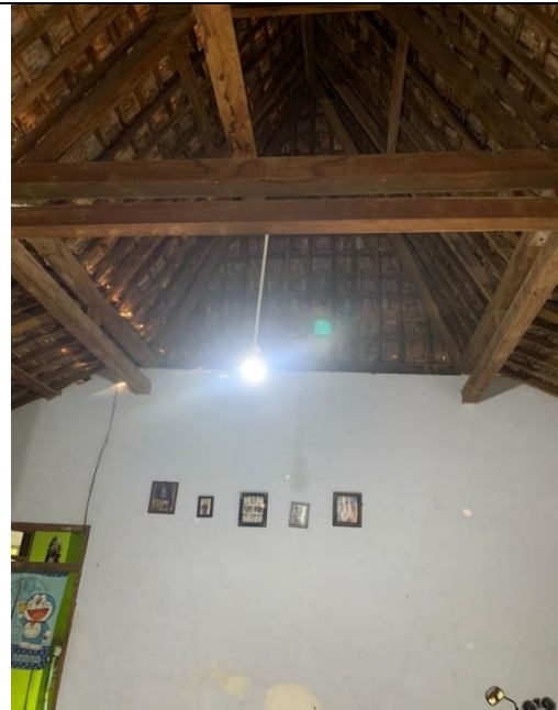
Pengukuran parameter pencahayaan di rumah non Penderita