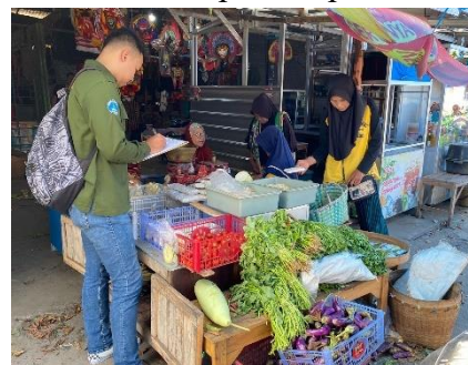
Gambar 6 Wawancara Pedagang