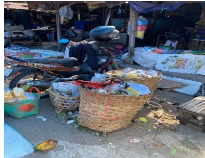
Gambar 2 Tempat sampah Pasar