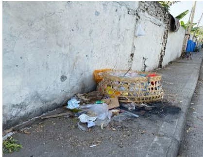
Gambar 1 Tempat sampah Pasar