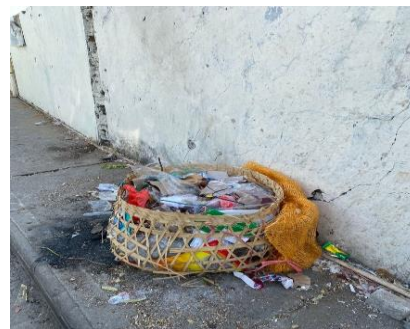
Gambar 4 Tempat sampah Pasar