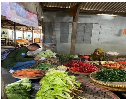
Gambar 5 Wawancara Pedagang