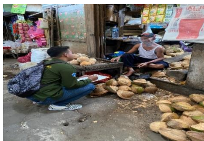
Gambar 7 Wawancara Pedagang