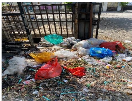
Gambar 3 Tempat sampah TPS